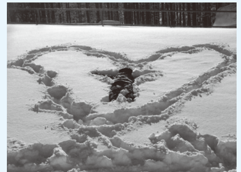
町外子ども部門 グランプリ 近藤心誠「心のときめき」