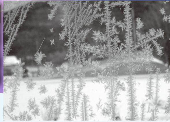
町民子ども部門 グランプリ 藤川純斗「まどにできたけっしょう」